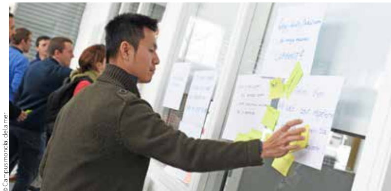
© Campus mondial de la mer

En 2 ans, 100 nouvelles fiches ont été mises en ligne et 13 nouvelles entreprises ont valorisé leurs équipements sur le portail.